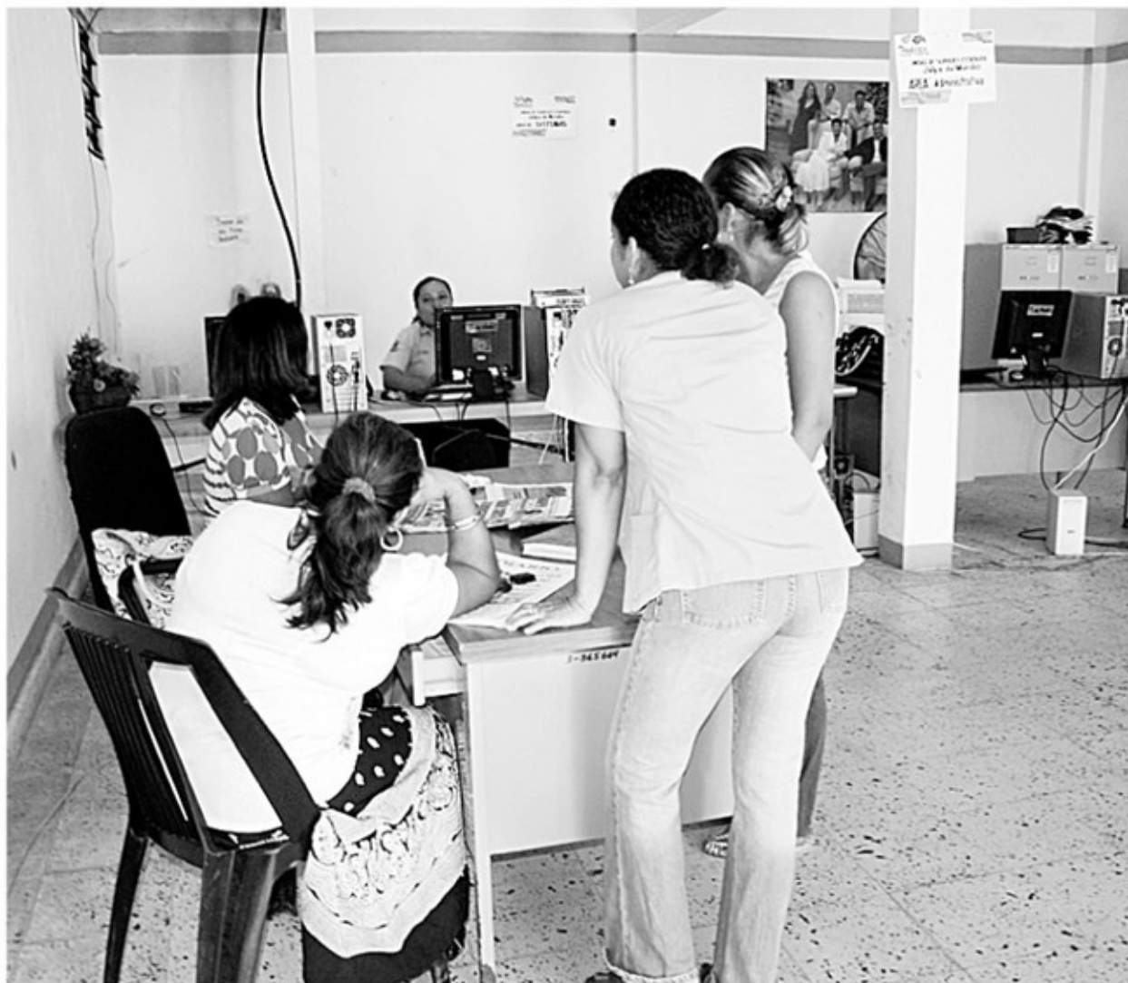
Funcionarios de la Casa de Gobierno de Jalpa de Méndez ocultan sus rostros de la lente de Tabasco HOY después del escándalo de las grabaciones.